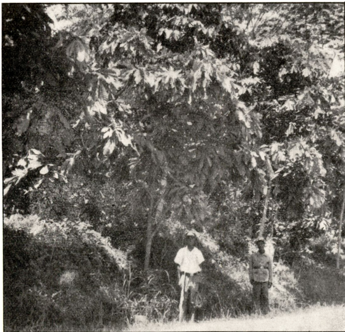
FIG. 16. — Gossweilerodendron balsamiferum âgé de 8 ans le 31 août 1948.