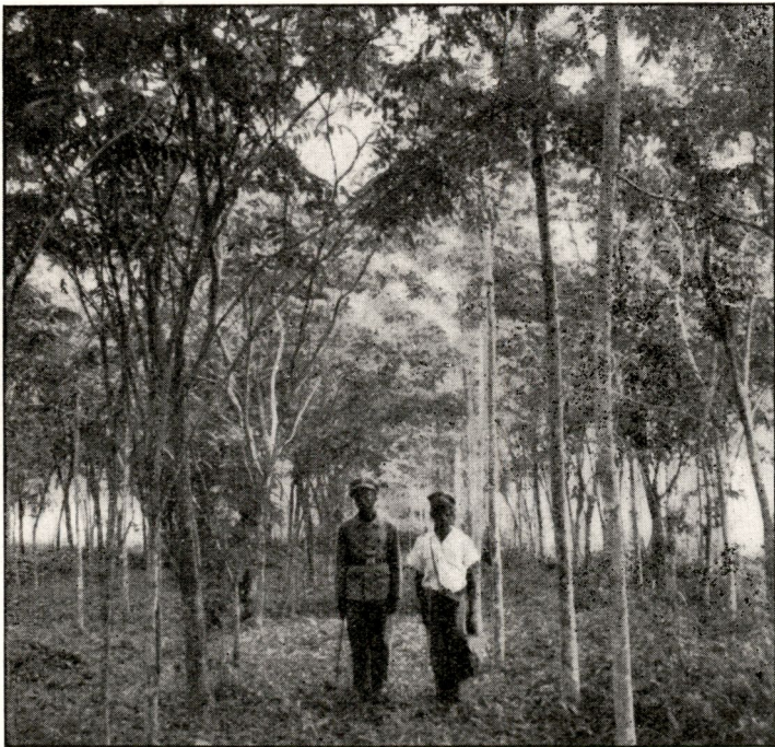
FIG. 26. — Dracaena sp. le 30 août 1948.