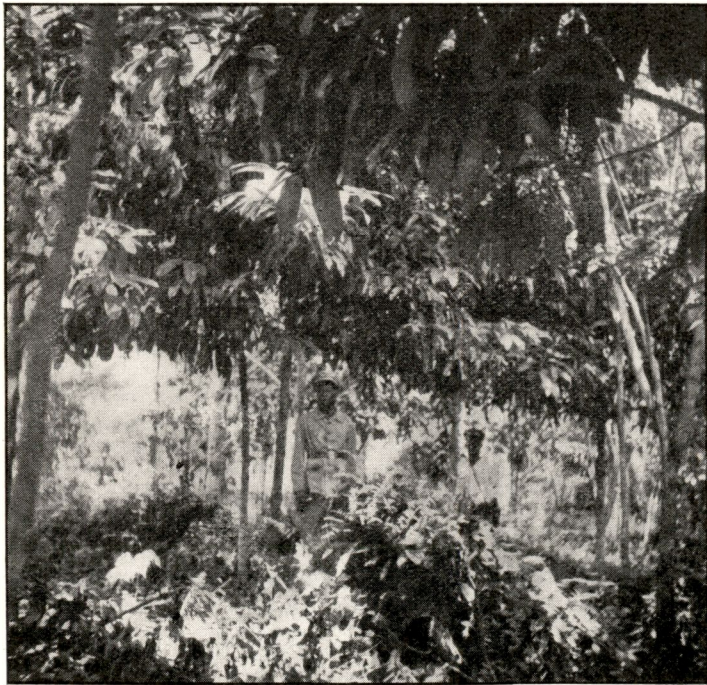
FIG. 24. — Entandrophragma Candollei (Alifi-litutu) semés en pépinière en août 1940, mis en place en août 1941, photo prise le 16-11-1944. Au centre de la photo Pachyelasma Tassmanii âgé de 5 ans.