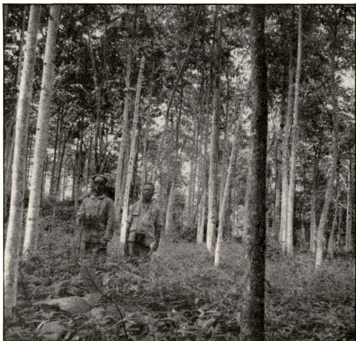
FIG. 6. — Cleistopholis grandifolia âgés de 7 ans. — 31 août 1948.