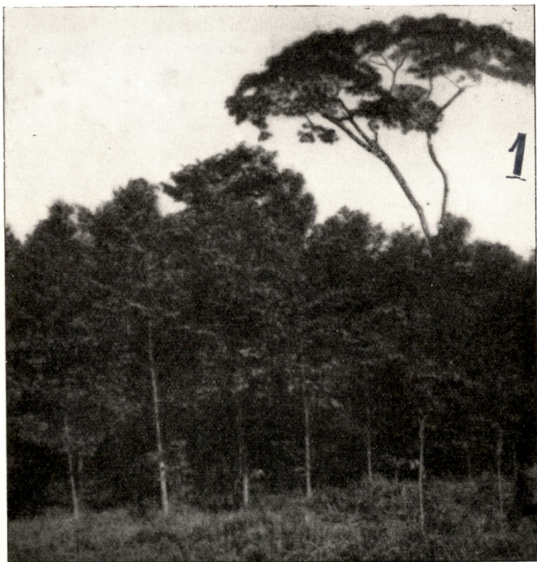
FIG. 4. — Terminalia superba âgés de 6 ½ ans.