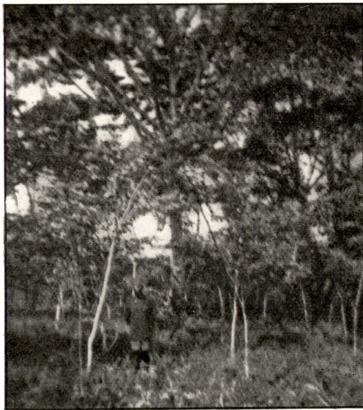
FIG. 8. — Xylopiya aethiopica âgés de 6 ans. — Le 30 août 1948.