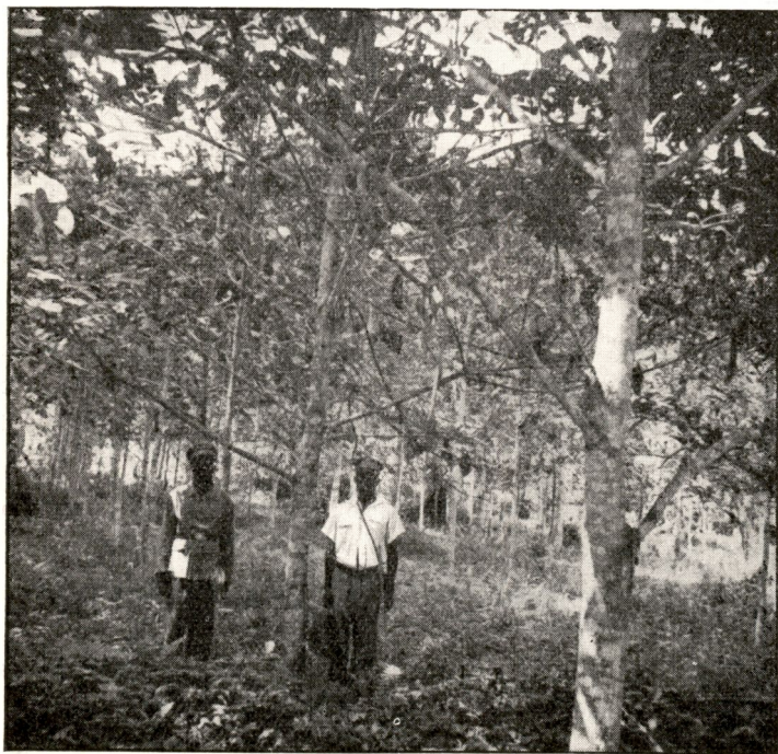
FIG. 29. -- Sarcocephalus Diderrichii âgés de 8 ans.