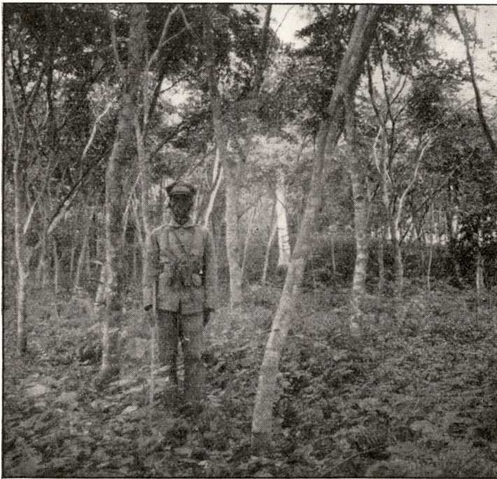
FIG. 10. — Millettia Laurentii âgés de 7 ans le 1 er septembre 1948.