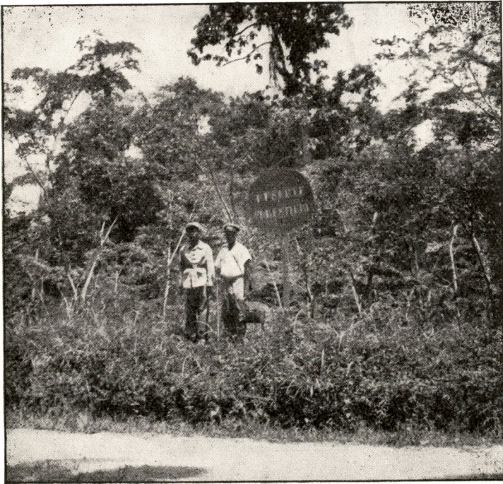
FIG. 14. — Afzrosia elata âgés de 7 ans.