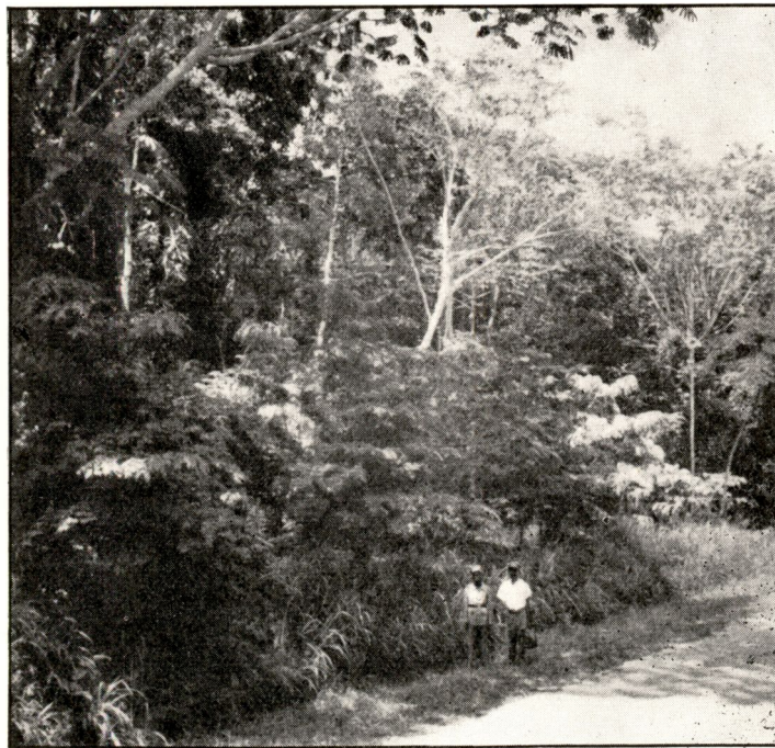
FIG. 12. — Pterocarpus Soyauxii âgés de 9 ans le 31 août 1948.