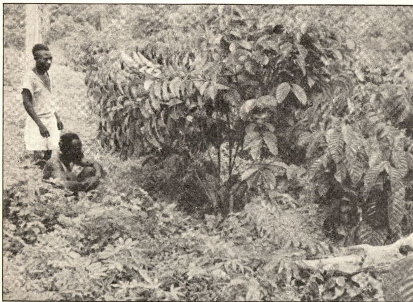
Jeunes caféiers après arcure partielle. Plusieurs tiges ont été dirigées vers l'espace dégagé, afin de ne pas encombrer à l'excès l'intérieur des lignes couplées.

RÉDACTION ET ADMINISTRATION : Place Royale, 7 - Bruxelles