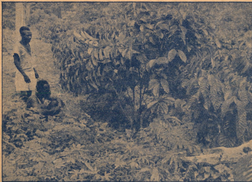
Jeunes caféiers après arcure partielle. Plusieurs tiges ont été dirigées vers l'espace dégagé, afin de ne pas encombrer à l'excès l'intérieur des lignes couplées.