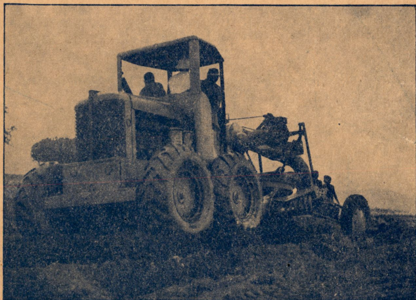
Niveleuse Allis-Chalmers AD4 pour la construction de terrasses (Cogerco).