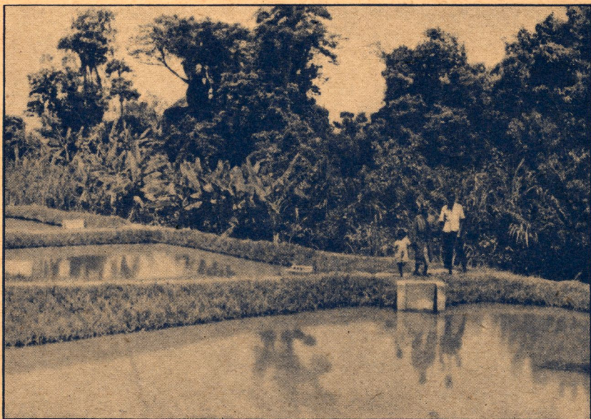
Etang d'alevinage pour Tilapia à Sentery (Cotonco).

RÉDACTION ET ADMINISTRATION Place Royale, 7 - Bruxelles