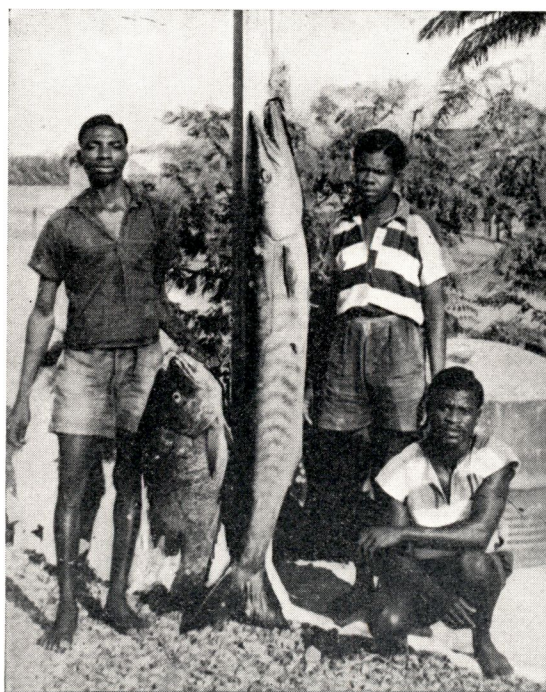
Spécimens pêchés à Banana