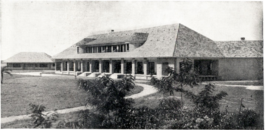
Hôtel Mangrove à Moanda