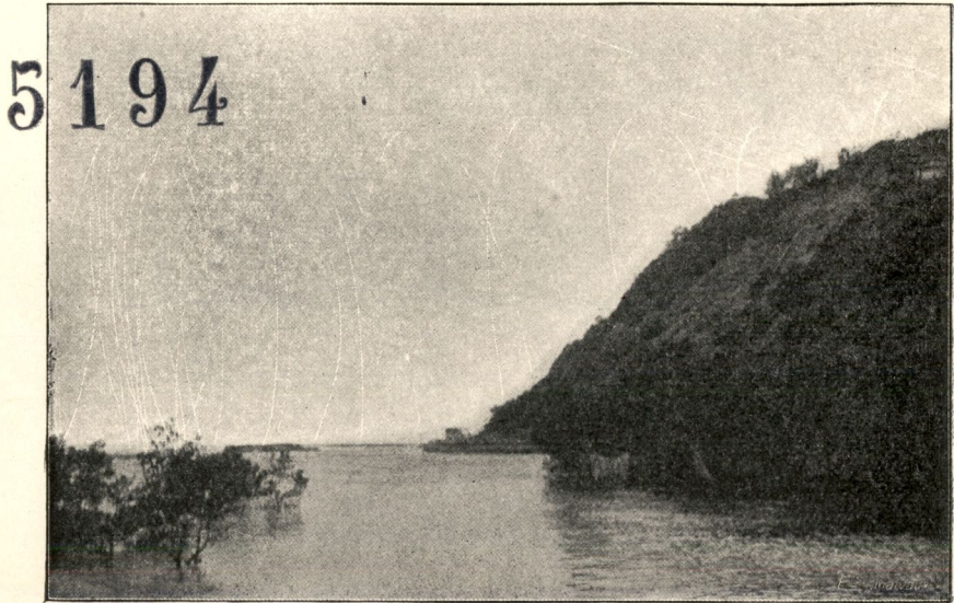
Fig. 19. — Embouchure de l'Umlazi, à Isipingo (Natal). (Photo Claus).

Les premiers envois d'œufs de truite venant d'Angleterre ne donnèrent guère de résultats par suite de la longue durée du voyage