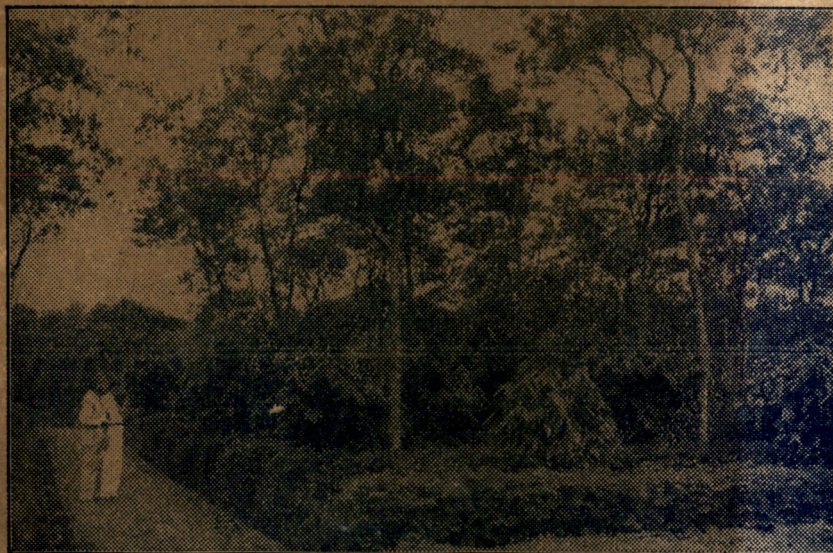
Jeunes cacaoyers sous ombrage de Leucaena glauca à l'École moyenne d'Agriculture de Malang (Java).

RÉDACTION ET ADMINISTRATION : Place Royale, 7 — Bruxelles