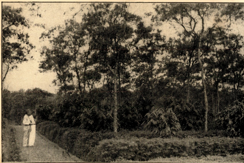
Jeunes cacaoyers sous ombrage de Leucaena glauca à l'École moyenne d'Agriculture de Malang (Java).